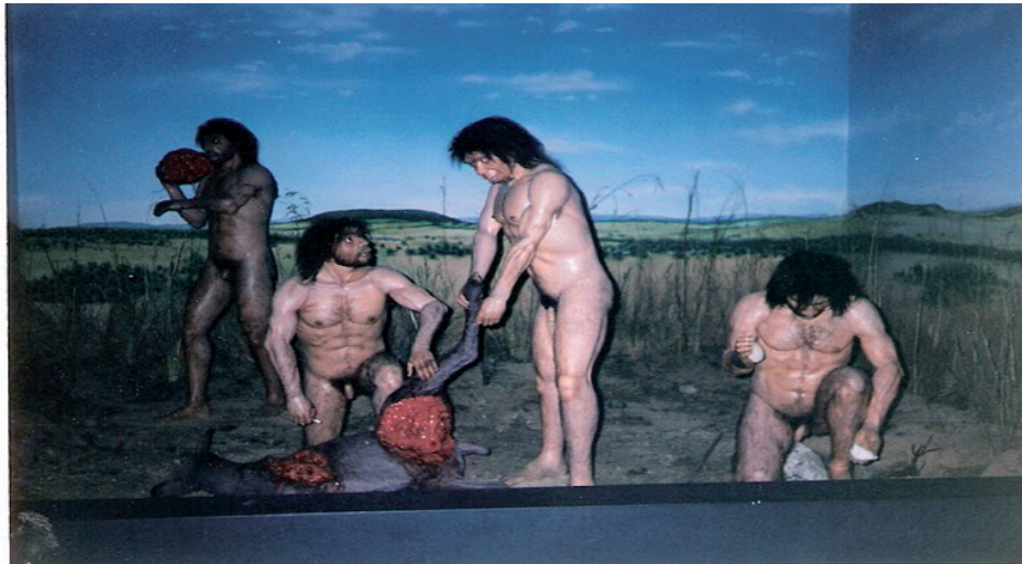
Hombre primitivo: Primer avance, la posibilidad de producir sonidos para comunicarse. A.c.